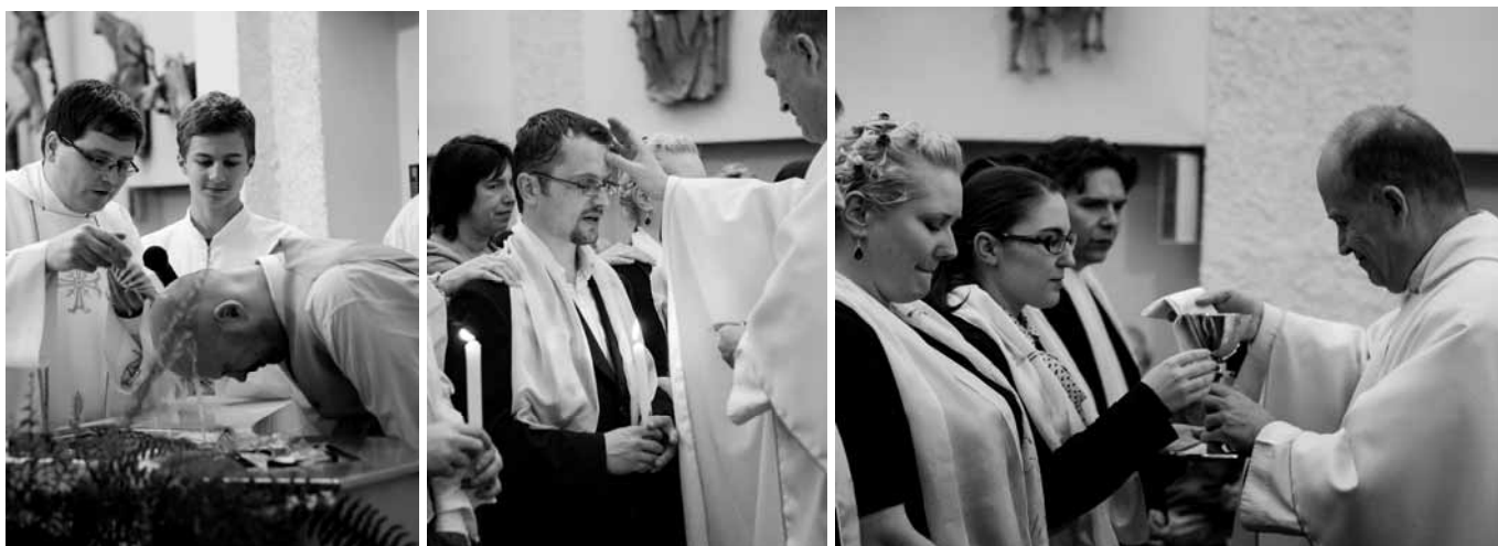
Křest, biřmování, první svatě přijímání