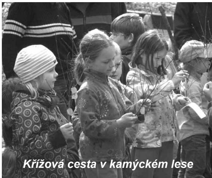
Křížová cesta v kamýckém lese

Již druhým rokem nám otec Jiří v postním období nabídl možnost, aby se jednotlivá farní společenství zapojila do přípravy a vedení křížových cest. Chtěla bych mu poděkovat, že nás pobídl k této aktivitě, která je obohacením nejen pro nás, ale věřím, že i pro ostatní farníky. Zároveň bych se s vámi chtěla podělit o dojmy z letošní křížové cesty, kterou připravovalo naše společenství maminek. Tento rok jsme se rozhodly křížovou cestu postavit na skutečných příbězích z našich rodin. Zpočátku jsme si nebyly jisté, jak bude tento, z našeho pohledu trochu odvážný pokus, přijat ostatními účastníky modlitby. Podle ohlasů ale mohu soudit, že jsem nebyla jediná, koho naše křížová cesta velmi oslovila. Byla jsem až překvapena tím, jak už během přípravy jsem byla vtažena do dramatu jednotlivých zastavení a zároveň velmi silně zasažena vědomím Boží přítomnosti v našich každodenních situacích i velikostí lásky a odevzdanosti Krista, který svou křížovou cestu prošel bez reptání a s touhou až do konce naplnit vůli svého Otce.