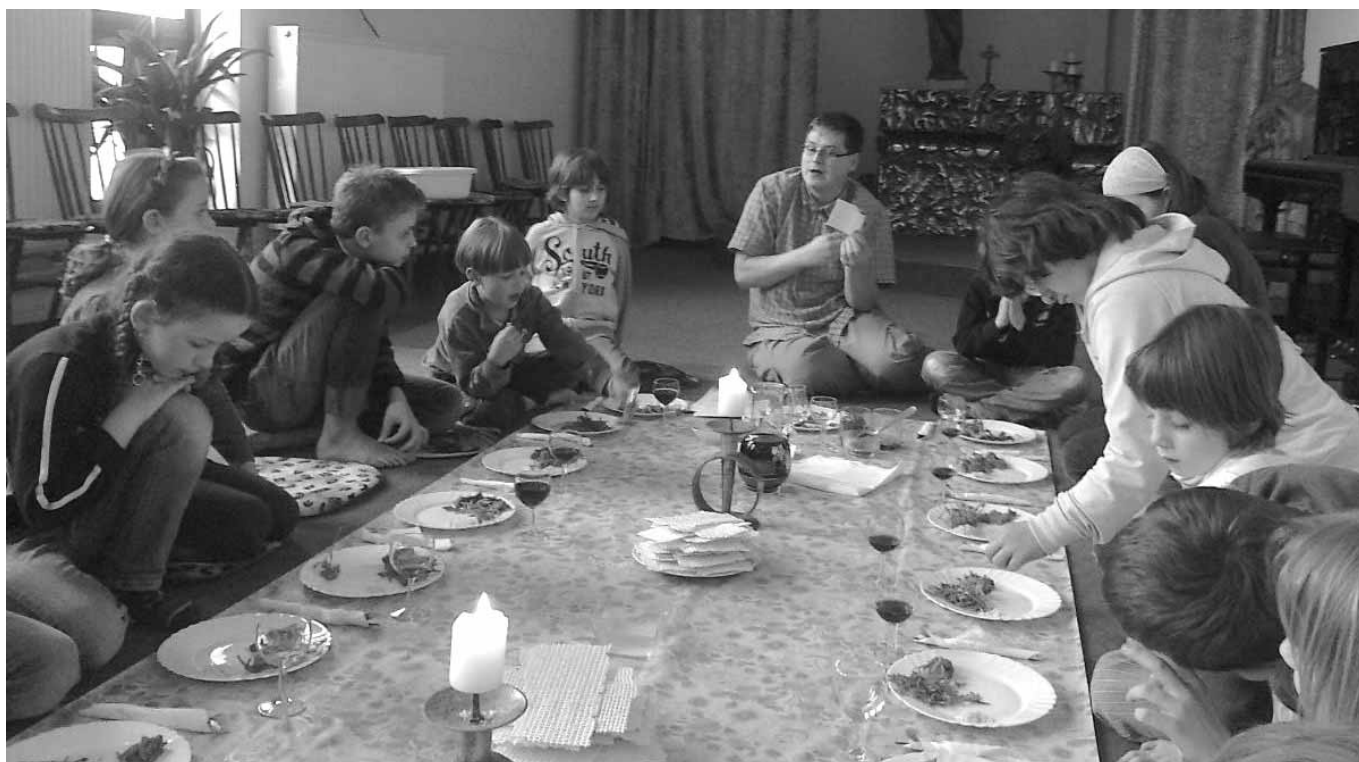
Příprava na první sv. přijímání