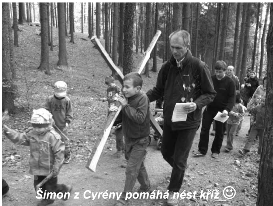
Šimon z Cyrény pomáhá nést kříž 😊

Křížová cesta začínala tradičně u restaurace "Na tý louce zelený". Sešlo se nás přibližně 25 dospělých a 20 dětí. Děti hned na začátku dostaly větvíčku ve tvaru malého stromku, na kterou u každého zastavení zavěšovaly jeden lístek se zjednodušeným vyobrazením daného zastavení. Mezi jednotlivými zastaveními jsme přenášeli velký dřevěný kříž, kdysi k tomuto účelu zhotovený P. Kamilem Vrzalem. Občas už