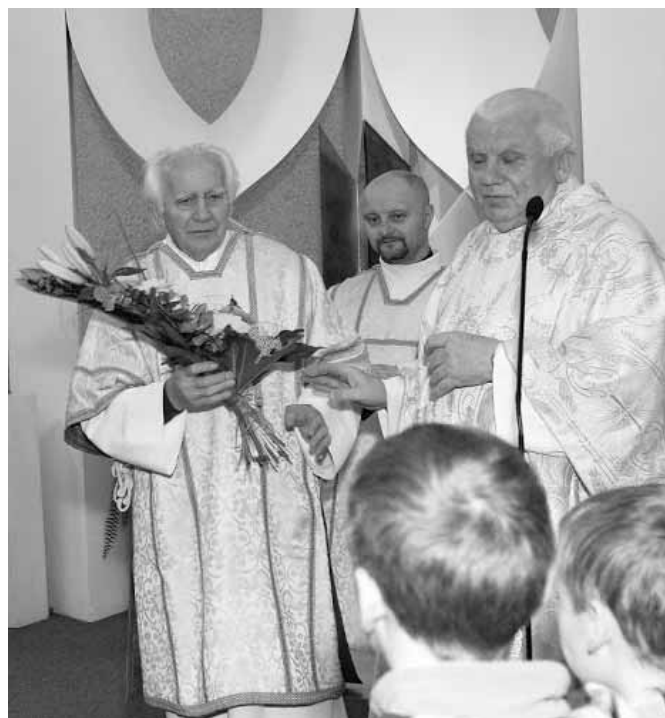
Foto ze Ihotického posvícení

Jáhen není poloviční kněz, je to služba, která může knězi hodně pomoci. Já jsem se kromě služby při liturgii specializoval na pomoc starým a nemocným v ústavech sociální péče na Vinohradech i v okolí Ihotického kostela.