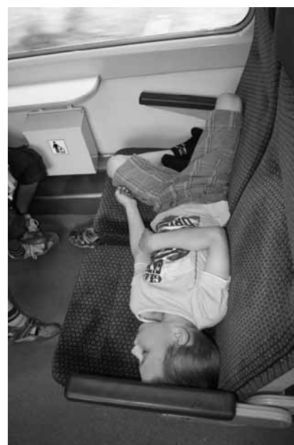
Dvě momentky z vlaku

byli promrzlí na kost, to byl pro všechny skvělý zážitek.