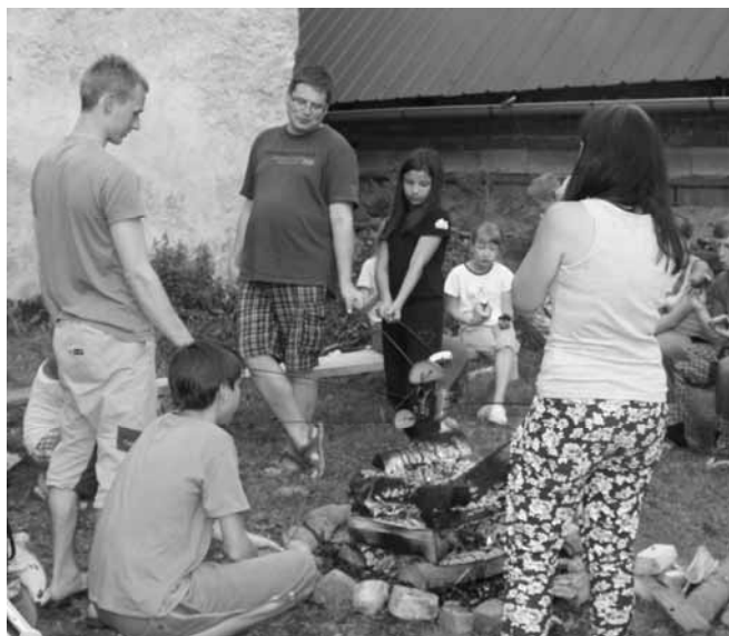
Co se upeklo? Foto z farní chaloupky

...bylo poslední zasedání pastorační rady, které se konalo třetího září. Nejdříve jsem společně s architekty a fundraiserem seznámil přítomné s aktuálním stavem příprav stavby a rekonstrukce: Probíhají pravidelné kontrolní dny, při kterých se jakožto zástupce investora společně s Ing. Jelínkem z arcibiskupství, scházím s architekty a zástupci dalších profesí, které se podílejí na přípravě projektu. Probíhá současně intenzivní spolupráce s úřady, která je někdy díky velkému množství požadovaných dokumentů, náročnější. Někteří se ptáte, kdy bude zahájeno oslovování farníků i dalších potencionálních dárců finančních prostředků. To bude možné, až přípravy dosáhnou takové míry, jakou požaduje arcibiskupství. Je to jistě rozumné. Bylo by hloupé, kdybychom začali ve velkém vybírat peníze a pak vám museli říct, že z důvodu komplikací se vše odsouvá třeba i o mnoho měsíců. To ale neznamená, že by náš fundraiser již intenzivně nepřipravoval celý koncept shánění potřebných financí. Prosím