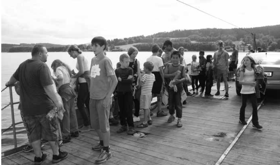
Výlet na Vltavě

Letošní chaloupky se konaly u Lipna v Horní Plané. Bydleli jsme na faře poblíž kostela. Počasí se nám více méně vydařilo. I když přšelo, tak nám starší kamarádi vymysleli zábavu, při