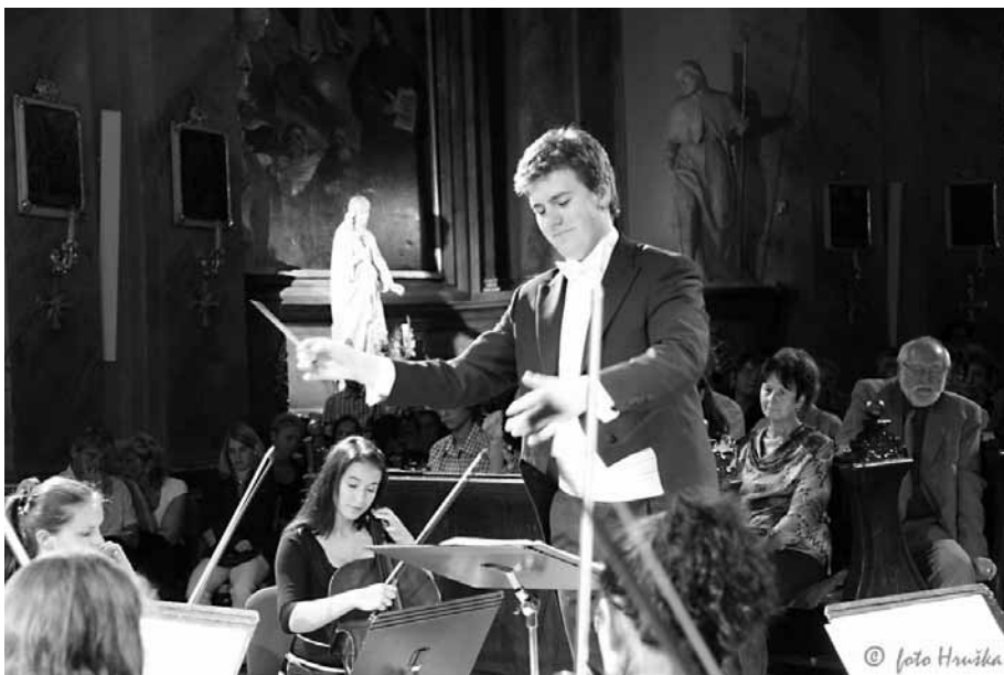
Koncert z Mezinárodního festivalu Petra Dvorského 2012 Jaroměřice nad Rokytnou, Český komorní ansámbl mladých – ČKAM

Nejdřív jsem začal hrát na klavír. Ale nerad jsem cvičil. Za to se mi líbila dudácká muzika, ve které hrály klarinety, housle, dudy, basa. Odjakživa jsem v ní chtěl hrát, proto jsem se dal na klarinet. Pan učitel na ZUŠ chtěl rozvíjet můj talent, ale já jsem mu to moc nedovolil. Hrál jsem spoustu lidových písníček, ale klasiku jsem moc necvičil. Jednou toho měl dost a chtěl, abych přešel na trubku. Naštěstí si toho všimnul jiný pan učitel a vzal si mě do třídy. Nechal mě hrát to, co mě bavilo. Pomohl mi splnit sen a vstoupil jsem do dudácké muziky, se kterou jsme byli úspěšní.