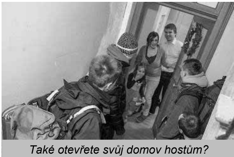
Také otevřete svůj domov hostům?

Všichni jsou také zváni k účasti na setkání tím, že otevřou své domovy – malé i velké – těm, kteří přijedou na evropské setkání. Mladí účastníci si přivezou spacáky a karmatky, můžou spát na zemi. Vřelé přijetí je