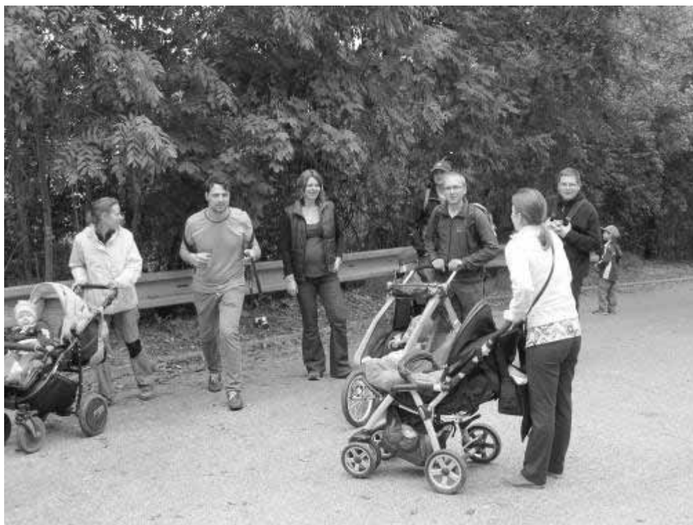
Na výlet do chuchelského háje se vydalo sedm rodin