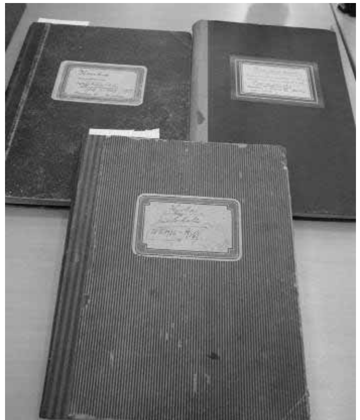
Knihy z Archivu hl. města Prahy