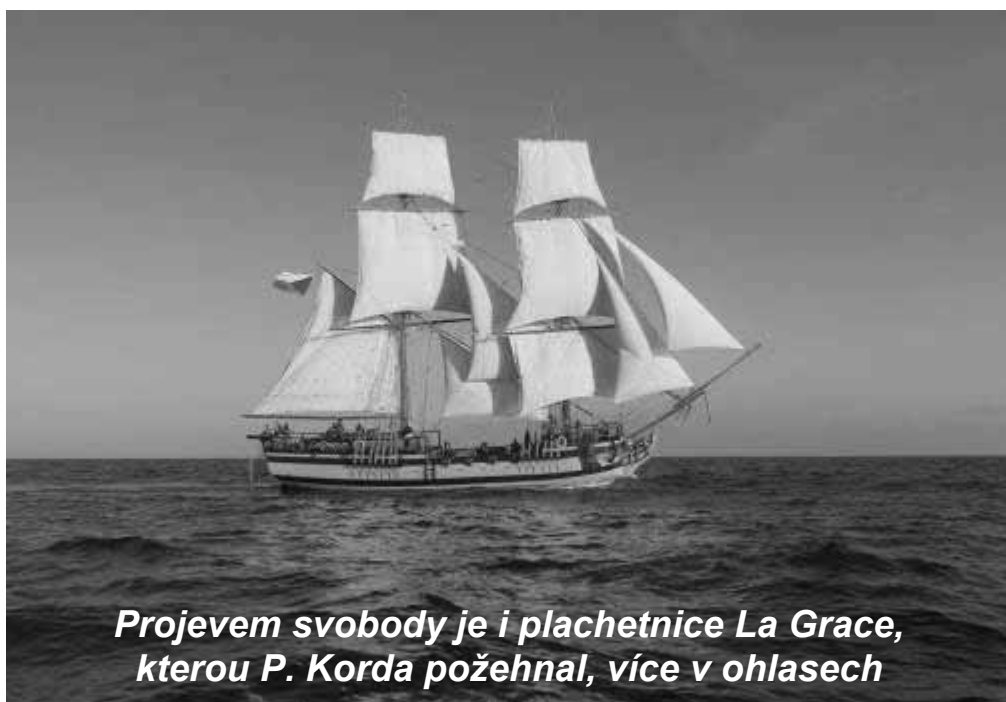
Projevem svobody je i plachetnice La Grace, kterou P. Korda požehnal, více v ohlasech