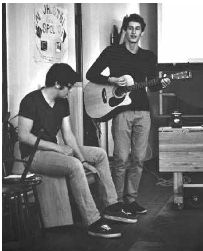
Kdo zpívá, dvakrát se modlí

účastníků, na ta jsem se však přímo po setkání zapomněl zeptat a už teď se nacházím hluboce po uzávěrce. (Tímto