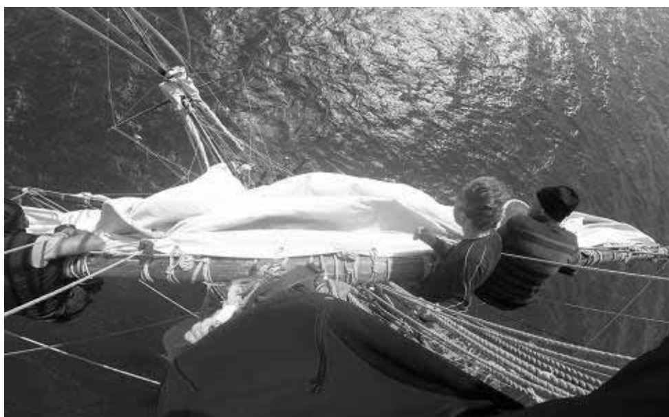
Spouštění přední košové plachty

JV: Byl jsem fakt rád, že Vašek pojede, protože jsem měl obavu, abych na tom požehnání nebyl jediný věřící. Bylo to totiž v rámci normální plavby, na kterou se mohl přihlásit kdokoli; jen na přihla- šovací stránce se psalo, že v neděli