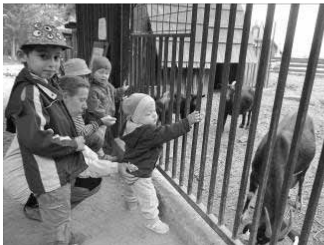
V lesní ZOO