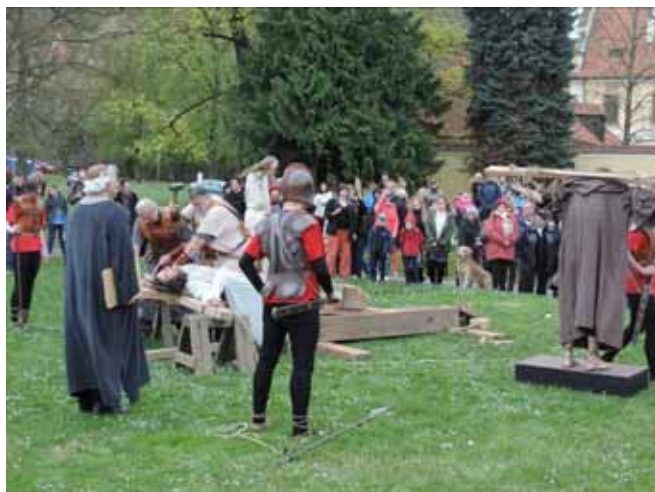
Křížování. Lid stál a díval se. (Lk 22,35)