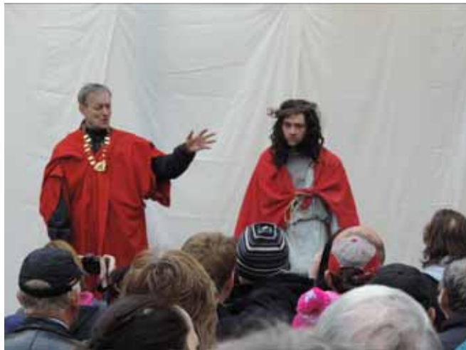
Ježíš před Pilátem