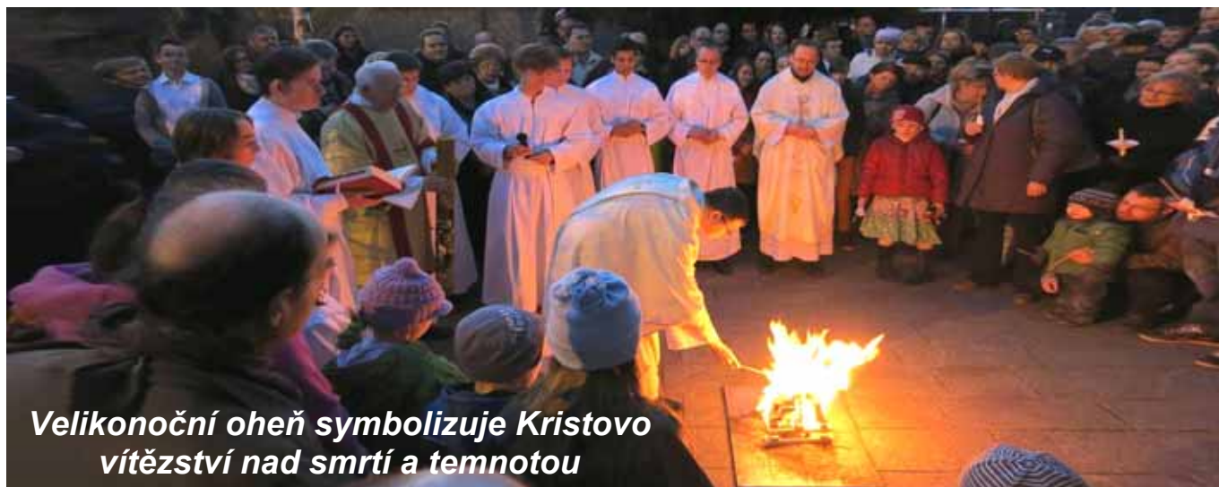
Velikonoční oheň symbolizuje Kristovo vítězství nad smrtí a temnotou