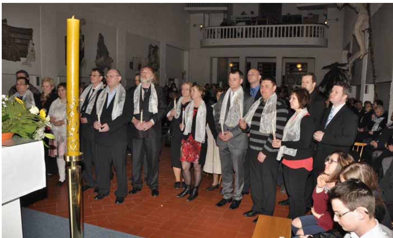
Nově pokřtění „dospěláci“ o vigilií Zmrtvýchvstání v noci ze 4. na 5. dubna 2015

VÝZVA FARNÍKŮM Děkujeme všem přispěvatelům a těšíme se, že se zapojí i další. Podělte se se svými zážitky, radostmi a zkušenostmi. Příspěvky posílejte na adresy uvedené v tiráži nebo předávejte osobně v sakristii. (red.)