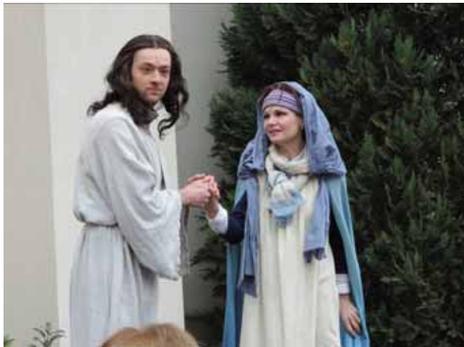
Ježíš se loučí se svou matkou Marií

V sobotu 18. dubna jsme se stali jeruzalémským lidem a přímými účastníky událostí z Jeruzaléma roku 33. Příští rok neváhejte, je to výjimečný prožitek.