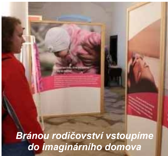
Bránou rodičovství vstoupíme do imaginárního domova

Rodičovství je jedinečný vztah na celý život. A právě výstava Obrazy rodičovství chce poukázat na jeho hodnotu od početí až po odchod dětí z domova, když si zakládají vlastní rodinu. Od 24. května do 7. června ji bude možné shlédnout v kapli svaté Zdislavy v kostele sv. Jiljí na Praze 1.