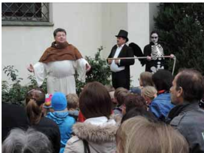
Jidáš, Satan a smrt