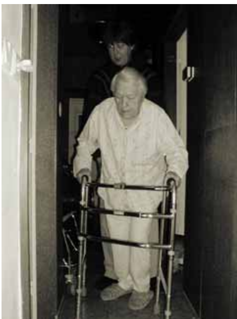
Opatrně, ať nezakopnem

Často mám pocit, jako by události chodily ve vlnách. Smrt této klientky byla první v nejdelsí vlně úmrtí v řadách našich klientů, kterou jsem za těch víc než patnáct let v Charitě zažila. Hned