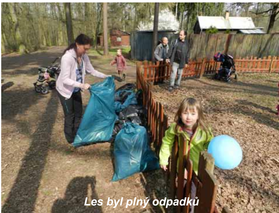
Les byl plný odpadků

Nevím, jestli to bylo jen tím báječným slunečným a opravdu teplým dnem, či spíše milou společností v pří-