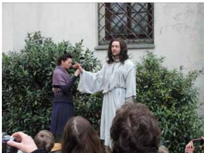
Vzkříšený Kristus nebo zahradník?