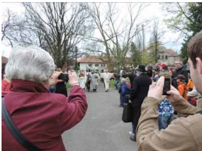
Slavný vjezd do Jeruzaléma si lidé fotili