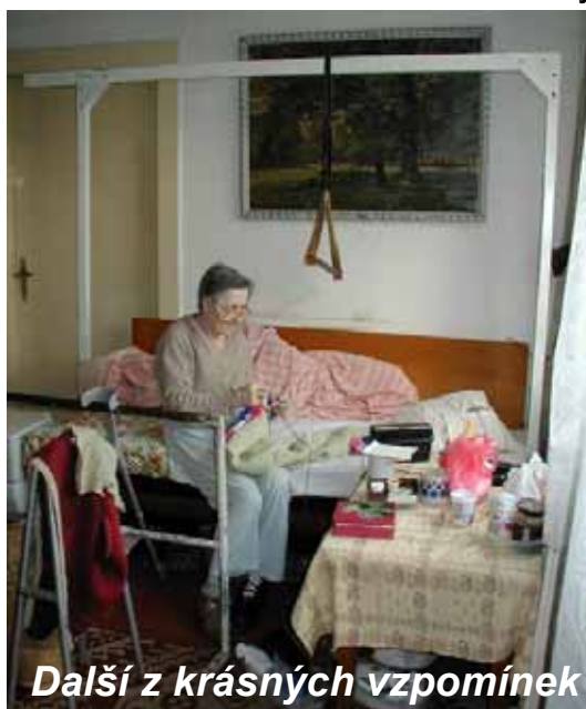
Další z krásných vzpomínek

Pan inženýr. O toho jsme se starali sotva pár dní. Z nemocnice ho pustili v poslední fázi onkologického onemocnění. Manželka i dcery si přály, aby mohl dožít poslední týdny doma. Sestřičky u něj zajišťovaly léčbu bolesti a podávaly infuze. S krmením a osobní hygienou pomáhaly pečovatelky. Pan inženýr měl velké bolesti, takže jsme museli situaci neustále