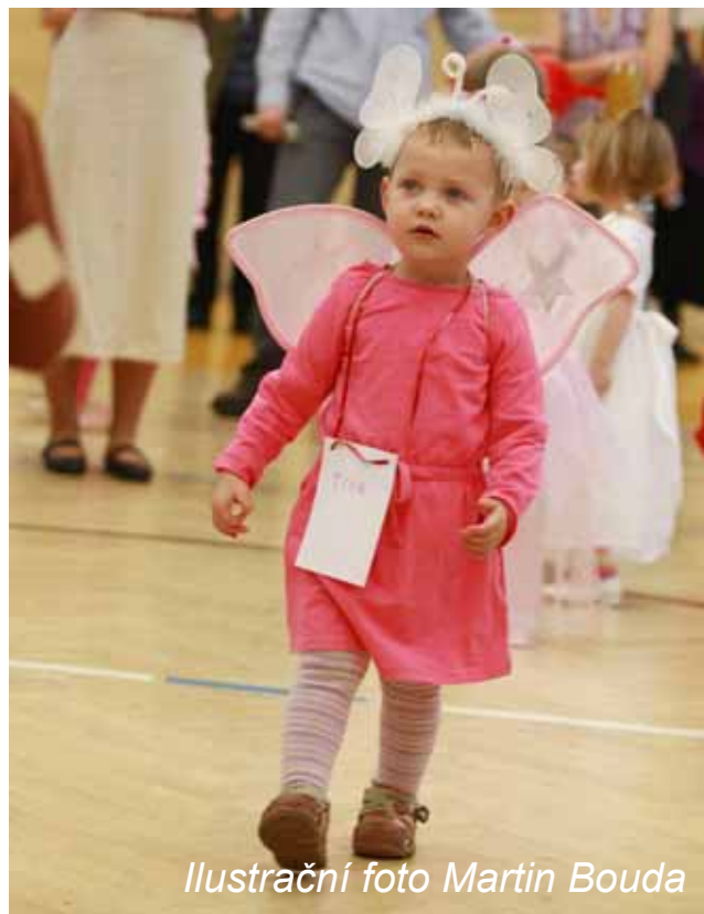
Ilustrační foto Martin Bouda