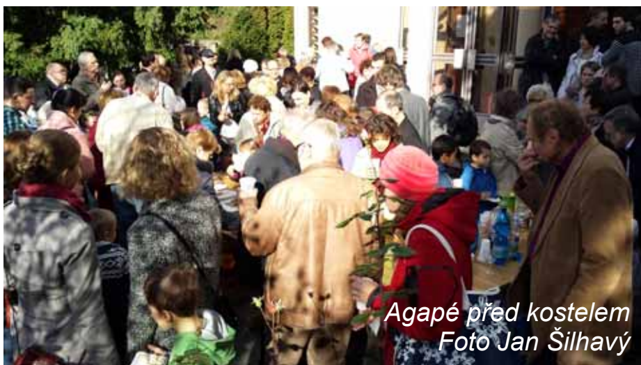
Agapé před kostelem