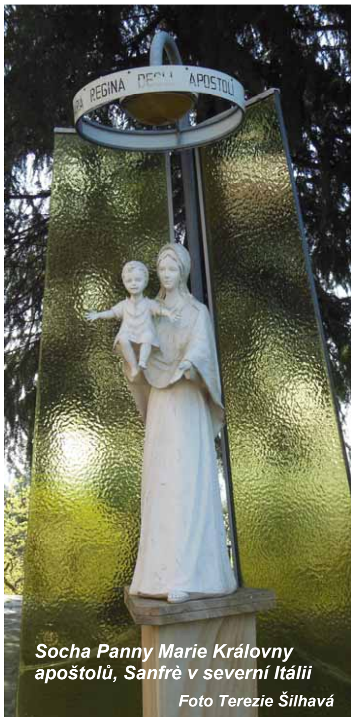
Socha Panny Marie Královny apoštolů, Sanfrè v severní Itálii

Nepochybuji o tom, že jsme tohle poselství všichni mnohokrát slyšeli. Maria je nositelkou naděje – už té starozákonní. Je tou, která řekla Ano nejen, když k ní