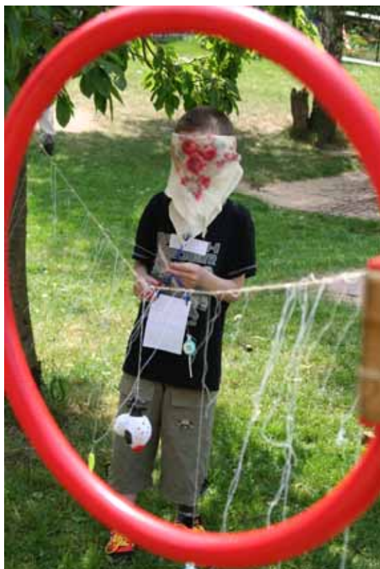
Foto ze Zahradní slavnosti 2015