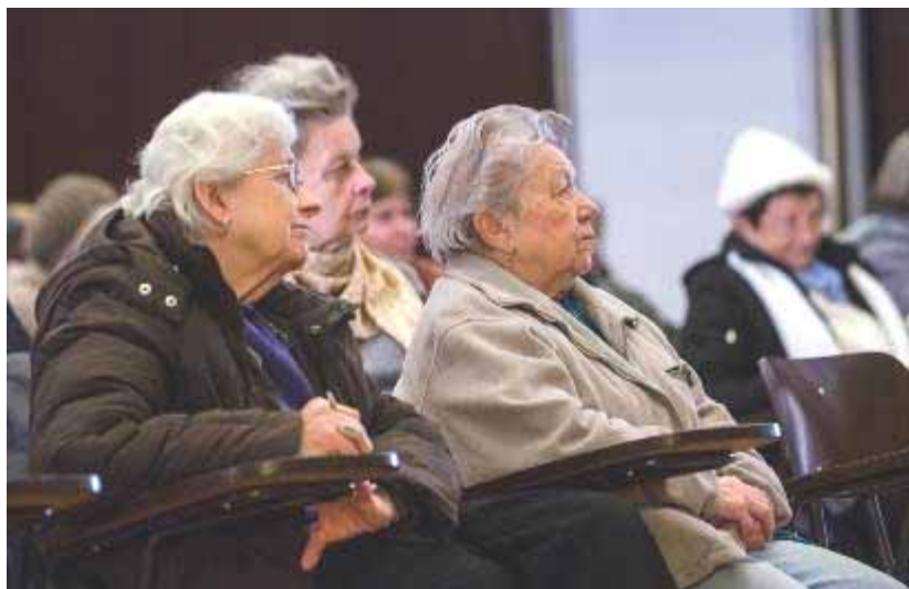
Lhotecké farnice ve „školních“ lavicích