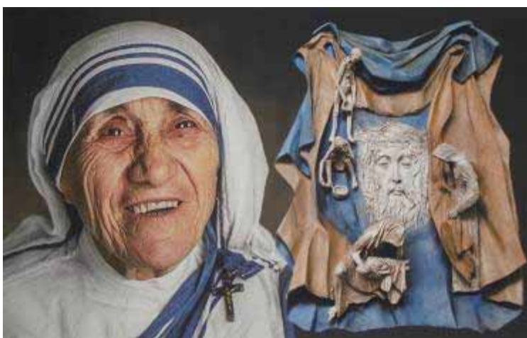
Matka Tereza na lhotecké křížové cestě