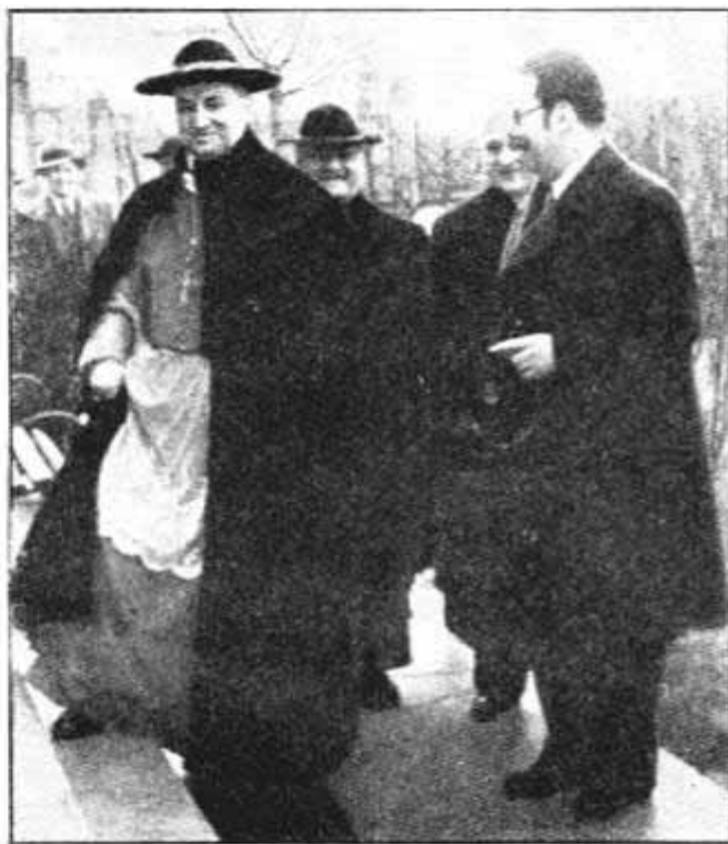
Kardinál Karel Kašpar na Lhotce v listopadu 1937

val kardinálem. Zemřel za druhé světové války 21. 4. 1941 a je pochován v katedrále sv. Víta.