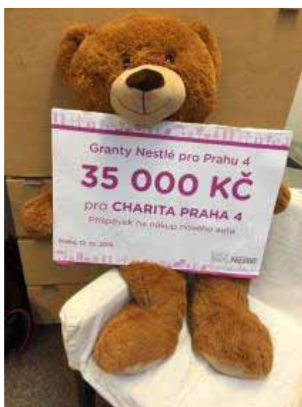
Grant pro Charitu

Děkuji vaší farnosti za podporu a přeji pokojný listopad. Eva Černá