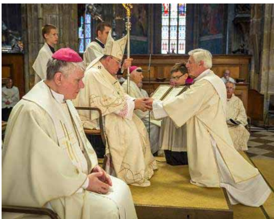
Z kněžského svěcení

V té době měli salesiáni otevřenou tzv. malou teologii, ilegální vzdělávací program. Ve studiu pokračoval i později