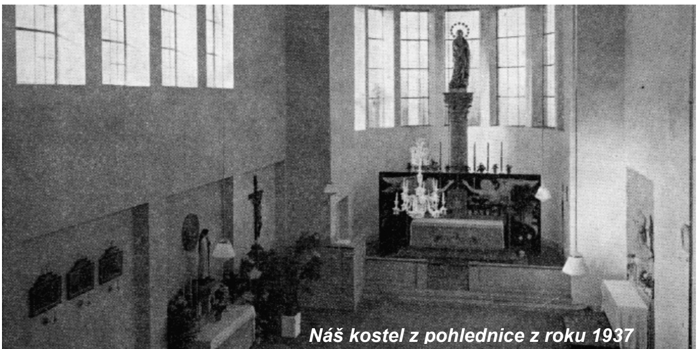
Náš kostel z pohlednice z roku 1937