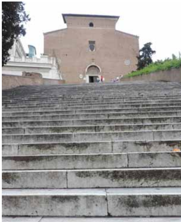
Nezastavujme se na cestě vzhůru