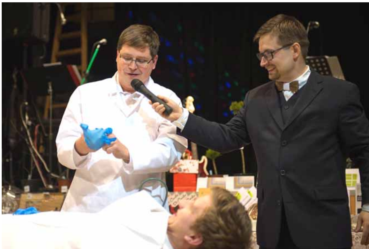
P. Jiří „v bílém“ zavzpomínal na svá studentská léta na lékařské fakultě