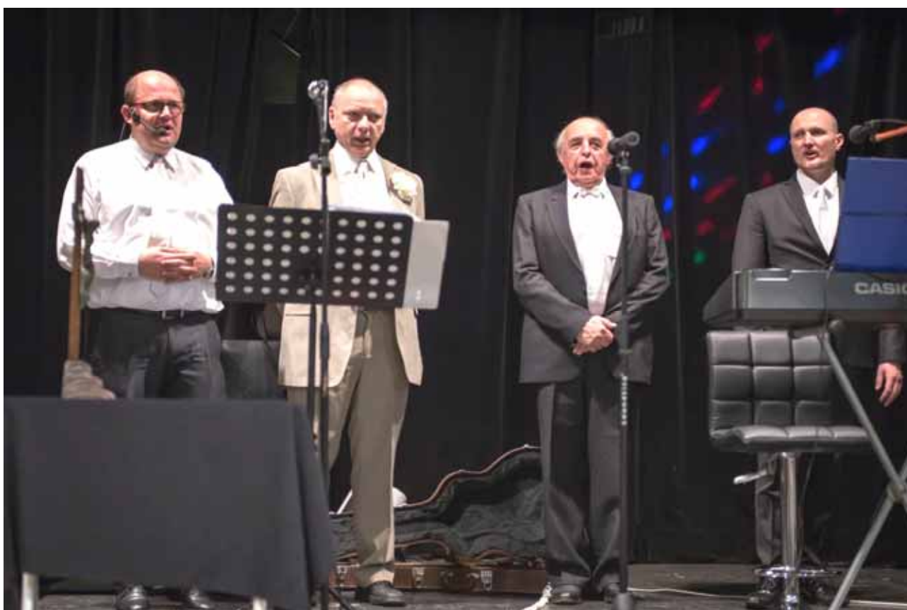
Program obohatili i naši zpěváci