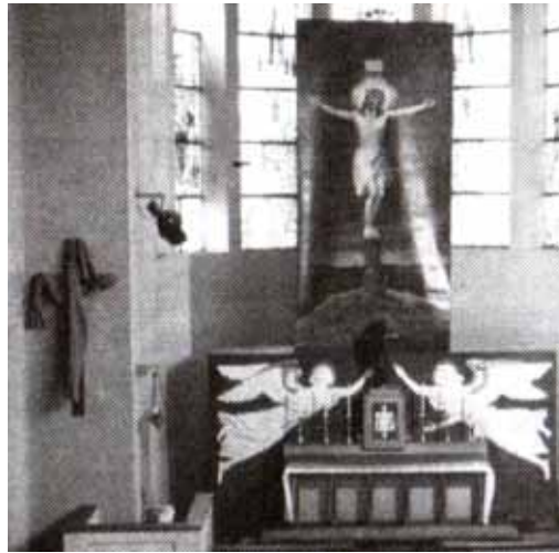
Zakrytý kříž a sloup P. Marie

není starý několik století jako středově- ká plátina, jeho krásná olejomalba a velký rozměr mají svou uměleckou hodno- tu a pro náš kostel, kdy slavíme 80 let, i hodno- tu historickou. A kdo by chtěl vidět, jak obraz vy- padal, zalistujte v publi- kaci „Kostel Panny Ma- rie Královny – historie a současnost“ vydané v roce 2007 při příleži- tosti 70 let kostela. Při- nášíme foto interiéru kostela před přestavbou se zavěšeným postním plátnem. Možná někdo má fotografie plátina i detailnější?