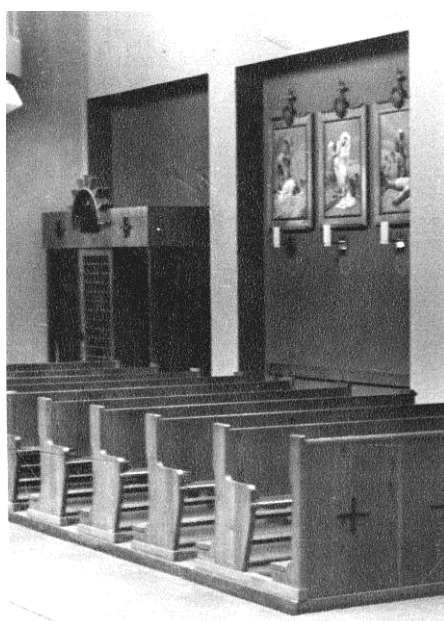
Původní křížová cesta a zpozděnice v místě současného vstupu do kaple Nejsv. Srdce Páně