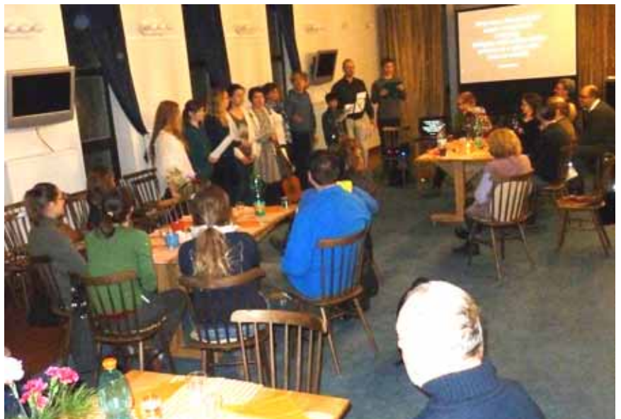
Program zpestřila kapela