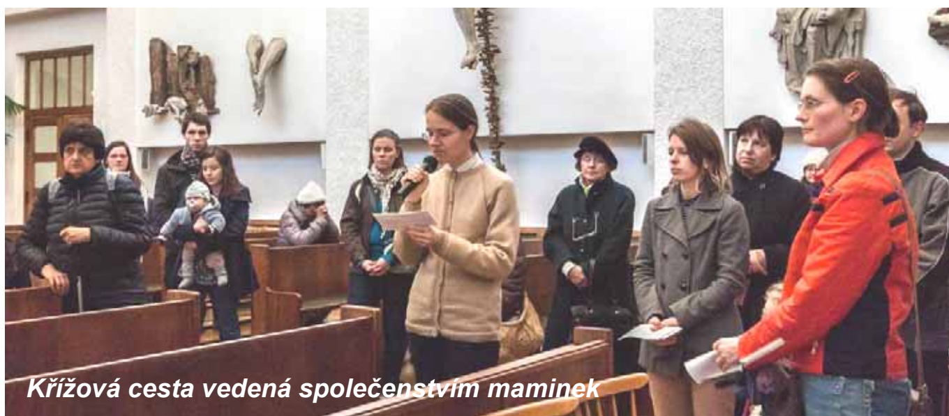
Křížová cesta vedená společenstvím maminek