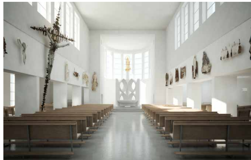
Vizualizace: Kostel rozšířený o boční lodě, jsou nové lavice, křížová cesta je výš

Dvanáct let příprav, diskuzí a úsilí máme za sebou. S Boží pomocí tedy vstupme do další fáze naší snahy o vytvoření takových podmínek pro pastorační činnost na Lhotce, které umožní šíření Kristovy radostné zvěsti i v budoucích letech.