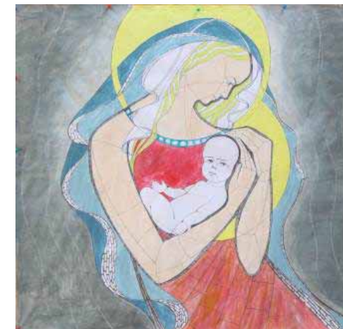
Pracovní návrh mozaiky na fasádu centra od sochaře Petra Váni