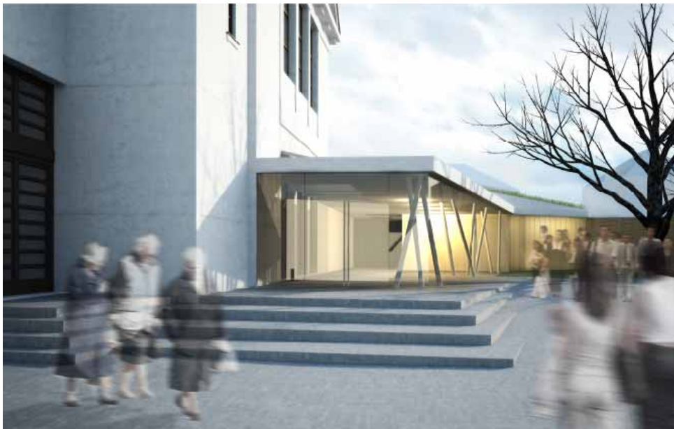
Vizualizace: Nový vstup do kostela