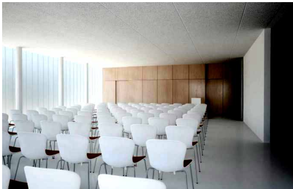
Vizualizace: Farní akademie v novém

Budeme tedy konfrontováni nedostatkem finančních prostředků v čase. Proto hodláme využít možnost půjčky od Arcibiskupství pražského, kterou budeme postupně splácet.