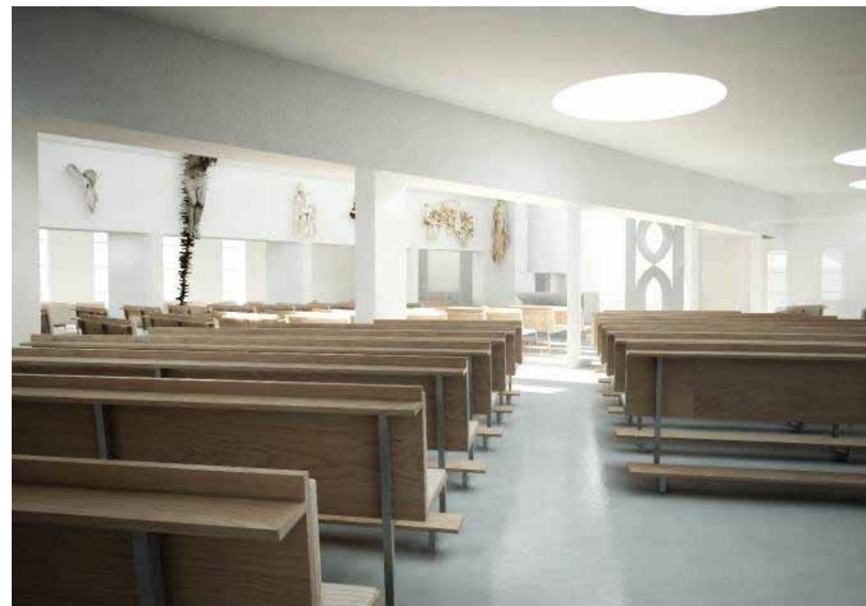
Vizualizace: Průhled z přístavby do hlavní lodě kostela

Mohlo by se zdát, že když naše farnost disponuje 2,5 miliony Kč, tedy 2,5 % celkových odhadovaných nákladů, jsme na tom špatně. Je však