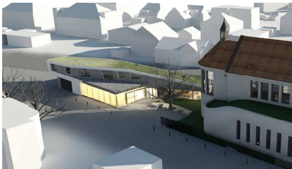
Vizualizace: Farní centrum u lhoteckého kostela