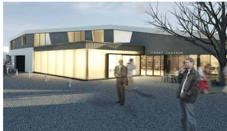
Vizualizace: Vstup do farního centra z ulice Ve Lhotce

ruje záměr lhotecké farnosti na zvýšení kapacity prostor pro setkávání a zlepšení podmínek pro bydlení duchovních.