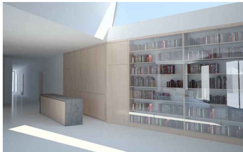
Budoucí farní knihovna