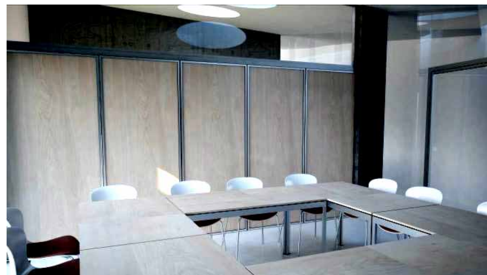
... se rozdělí na dvě menší klubovny posuvnou příčkou