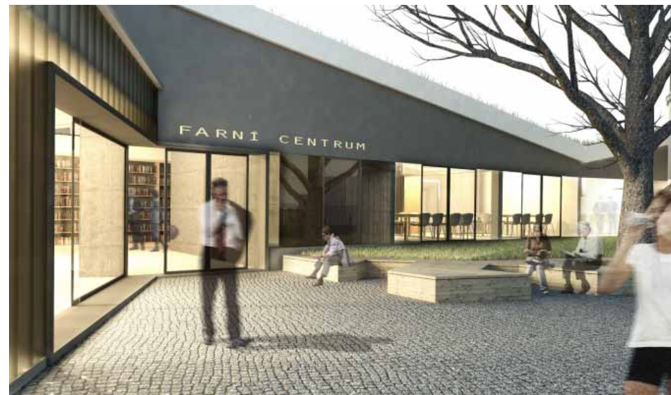
Vizualizace: Nádvoří farního centra