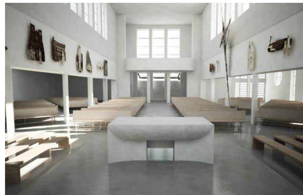
Vizualizace: Pohled od oltáře ke vstupu