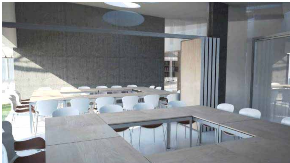
Vizualizace: Velká klubovna...