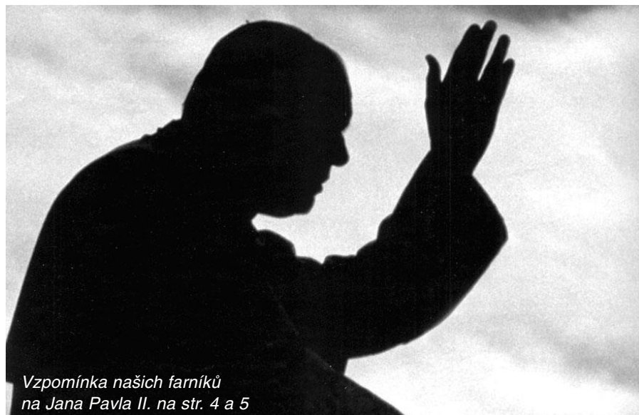
Vzpomínka našich farníků na Jana Pavla II. na str. 4 a 5