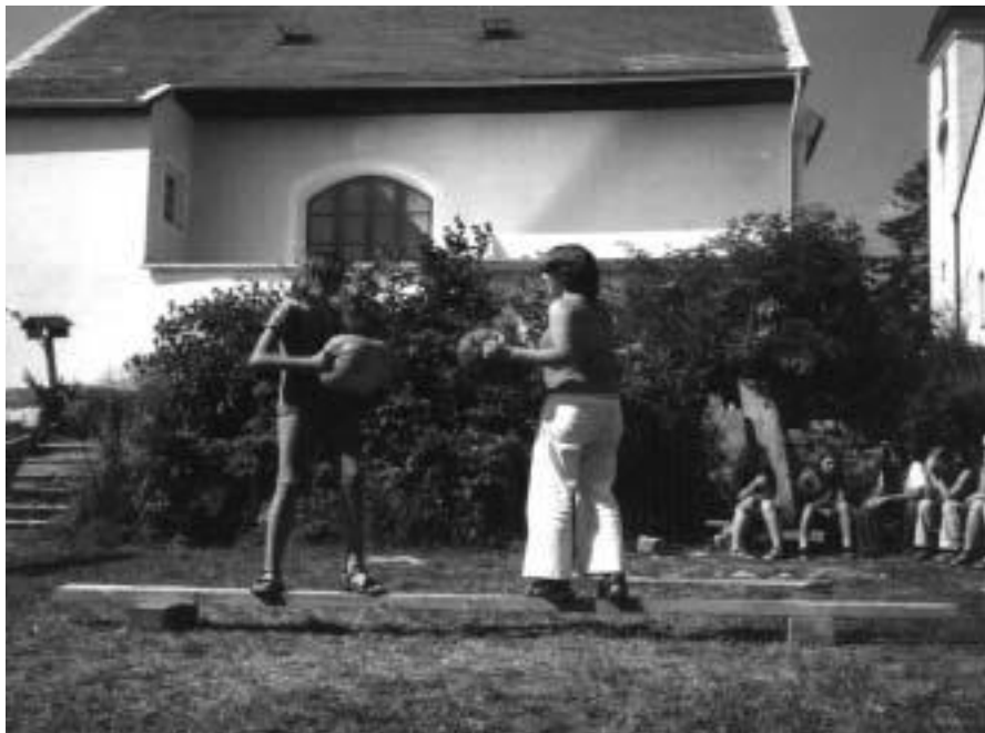
Fara v Horní Cerekvi, kde budeme bydlet

(Z článku Petra Křížka k výstavě fotografií z chaloupek)