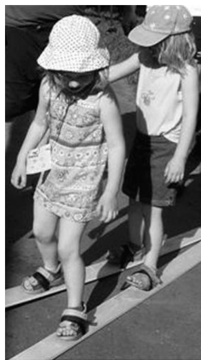
... ale zájem byl také o neobvyklé lyžování.

O hlavní překvapení se již před akcí postarala nafukovací skákací žirafa, kterou možná znáte z náměstí u metra Budějovická. Tu nám její majitel zapůjčil poté, co se jinde nepodařilo sehnat za přiměřenou cenu skákací hrad. Když byla dovezena, ukázalo se, že se vzhledem k obřím rozměrům nejspíše na zahradu školky nevejde. Nakonec se po značném úsilí všech pomoc-