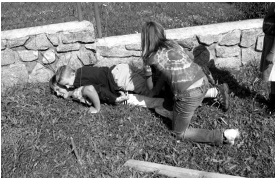
Družstvo Vlčí čelisti překonává opičí dráhu.