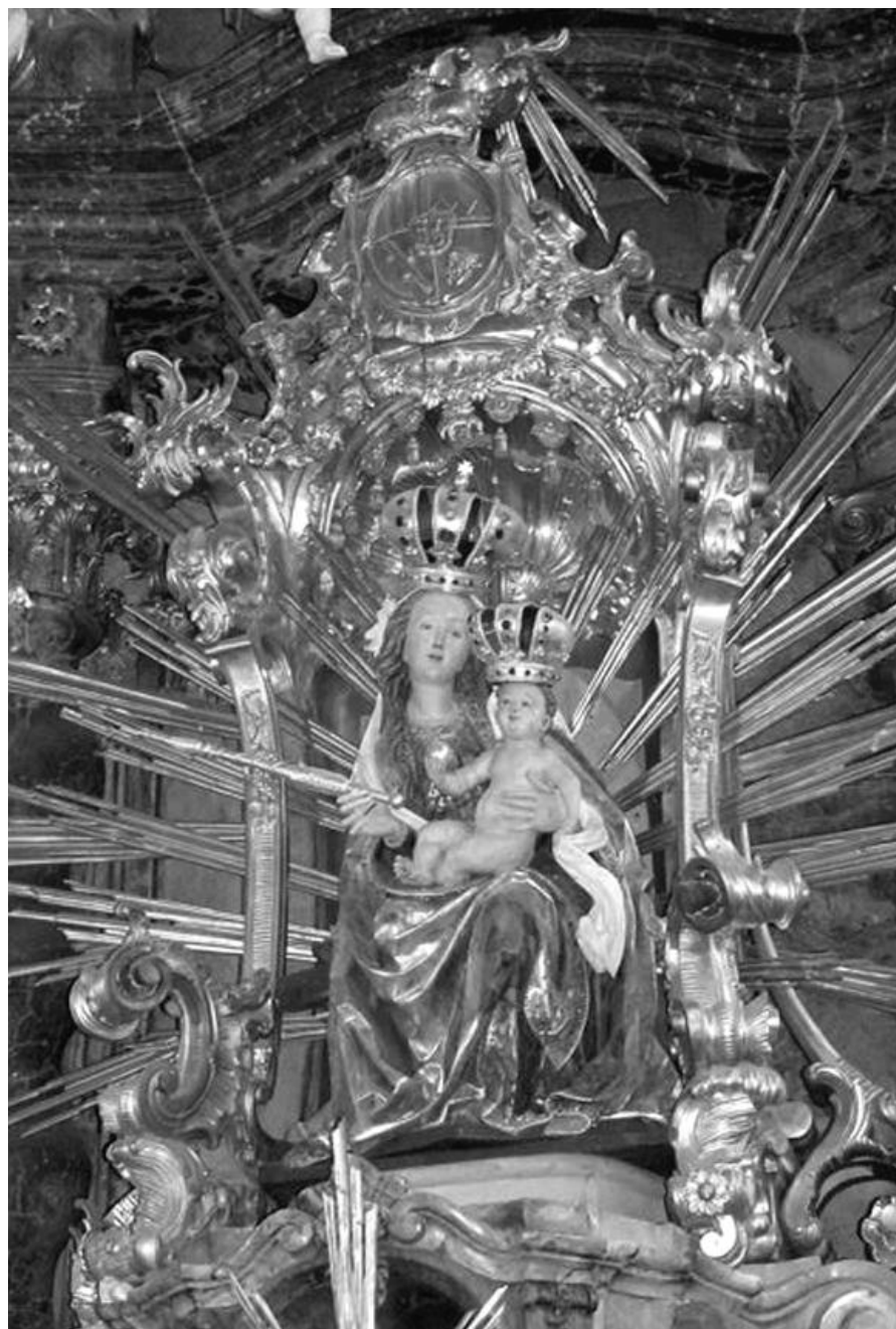
Kájovská Madona s Ježíškem.