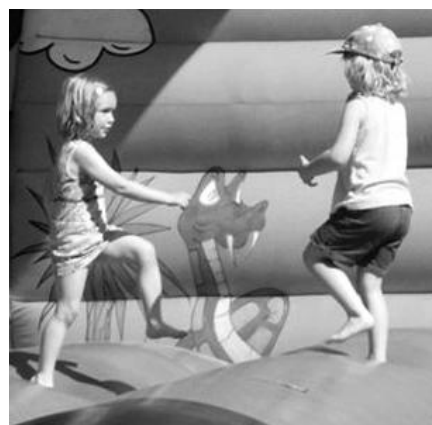
Mnoho radosti dětem udělala žirafa na skákání...

Zahradní slavnost ve Studánce – červnové odpoledne, kdy spolu můžeme pobýt, než se rozprchne na prázdniny – je již v naší farnosti tradicí. Letos se slavnost konala v neděli 18. června za vydatné přízně sluníčka i množství příchozích.