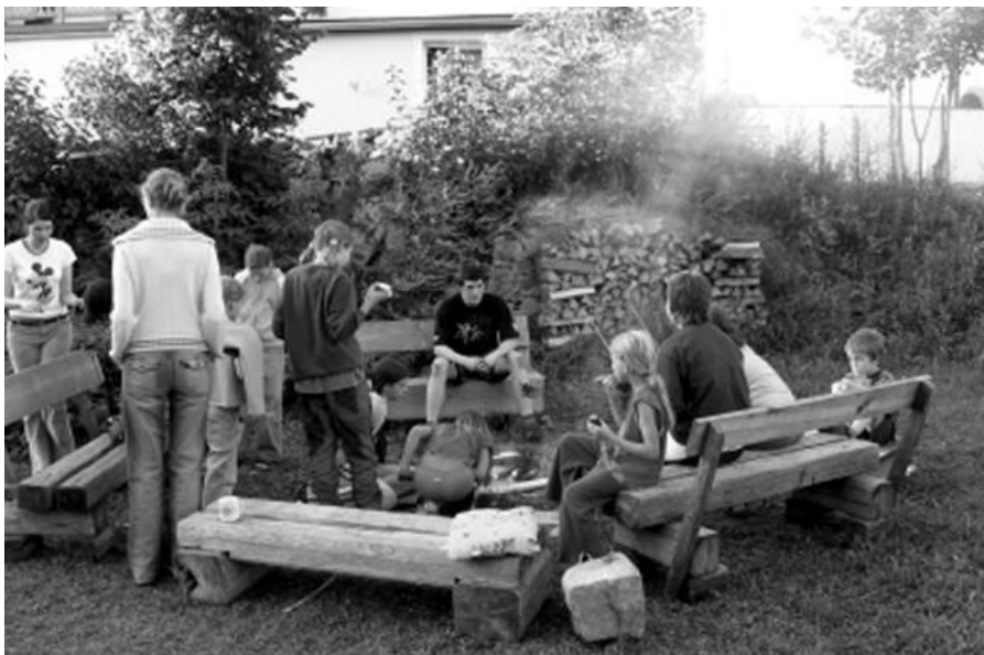
Tradiční i oblíbené opékání špekáčků.