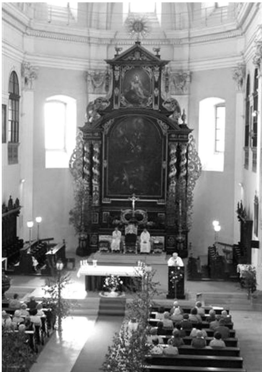
Poutníci ze Lhotky při mši v litoměřické katedrále sv. Štěpána.

Zdejší duchovní správce – mladý německý kněz mluvící dobře česky, i když s německým přízvukem – nás rovněž překvapil. Nejen že nás přivítal netradičně pouze v trenýrkách a tričku, ale ještě vedoucí našeho