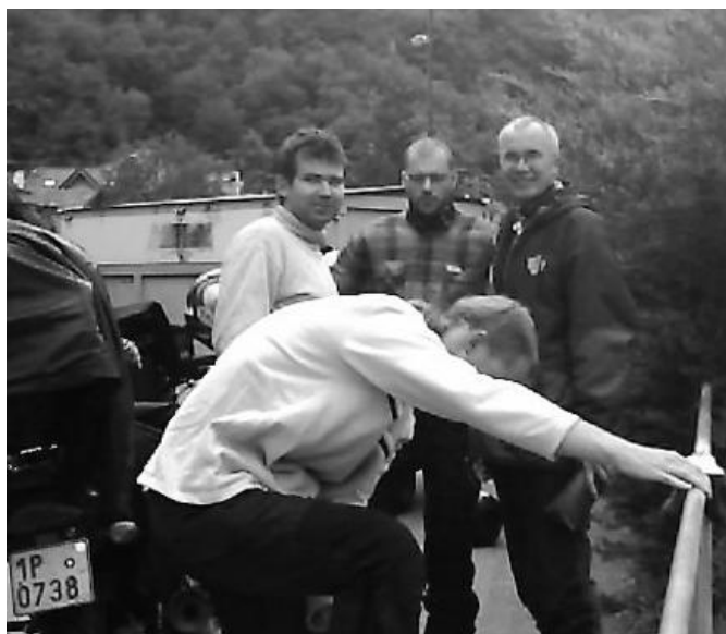
Řekli byste, že tihle chlapíci jsou kněží? A že jich bylo pět? A kde že je ten pátý? Ten přeče fotografuje.