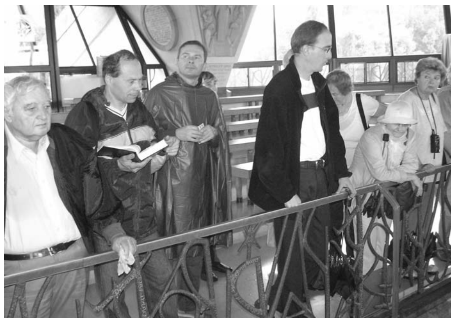
Nad základy domu sv. Petra v Kafarnau.