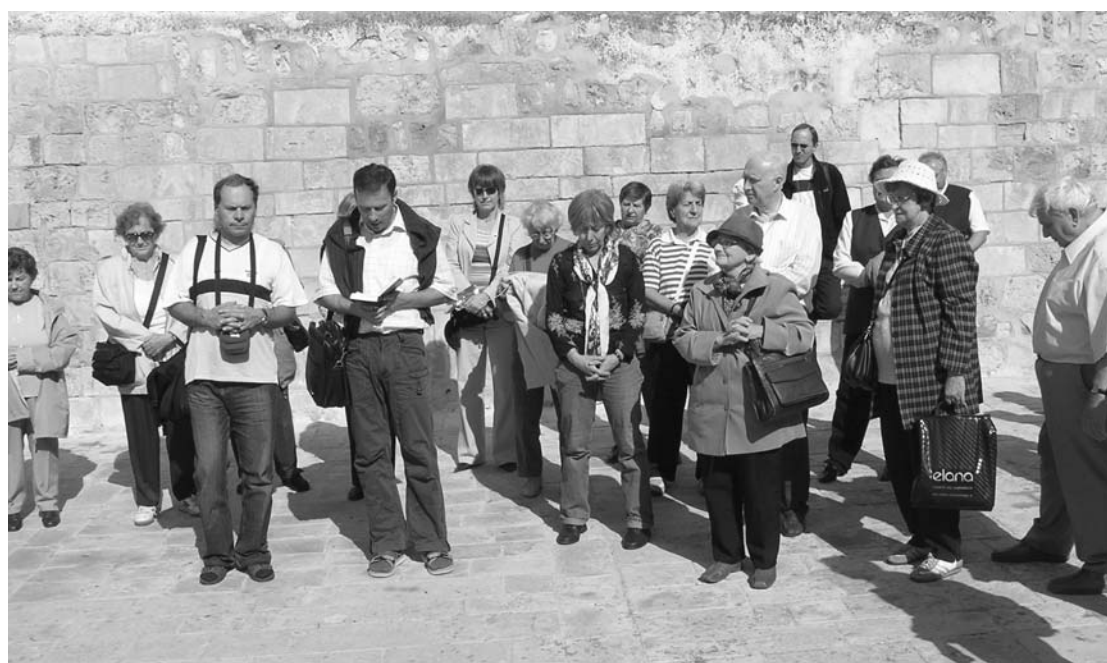
Dvanácté zastavení jeruzalémské křížové cesty. ►