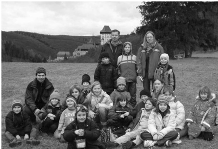
Přesně tolik nás došlo ke hradu Karlštejn.