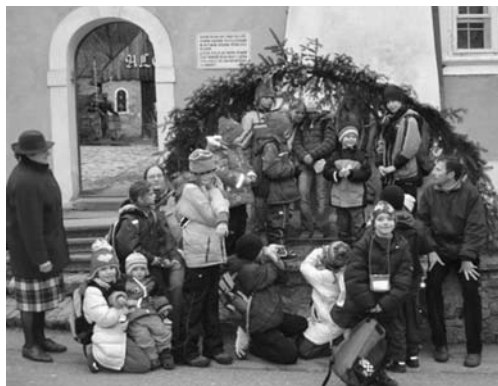
Po prohlídce jsme si sami ještě jeden „betlém“ vytvořili.