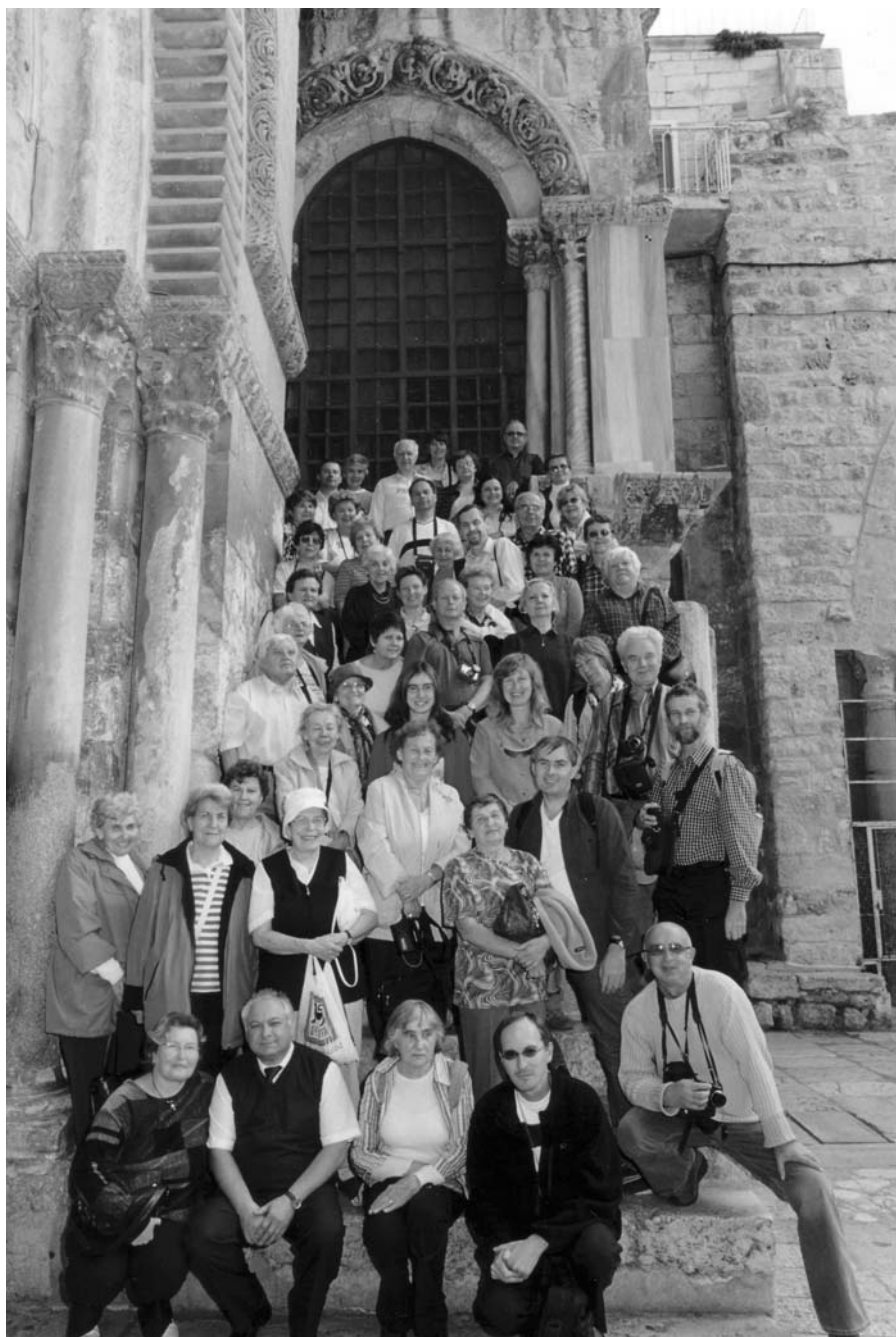
▲ Lhotečtí poutníci před kaplí Golgoty