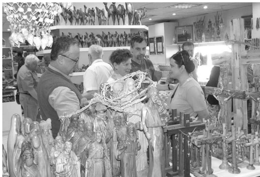
Co si vybrat v Betlémě domů na památku?