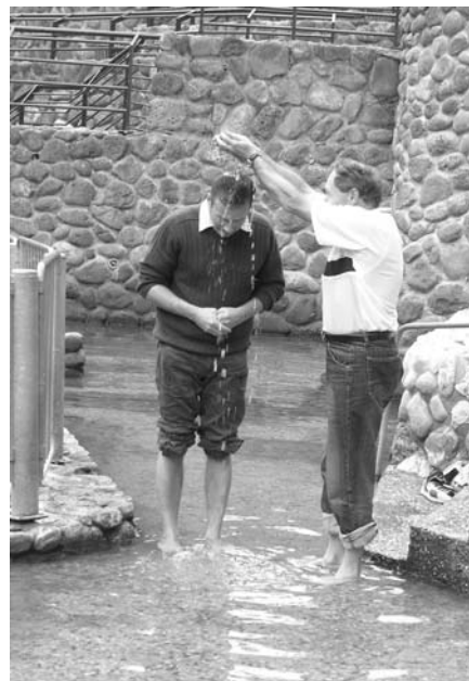
Obnovení křestních slibů v Jordánu.