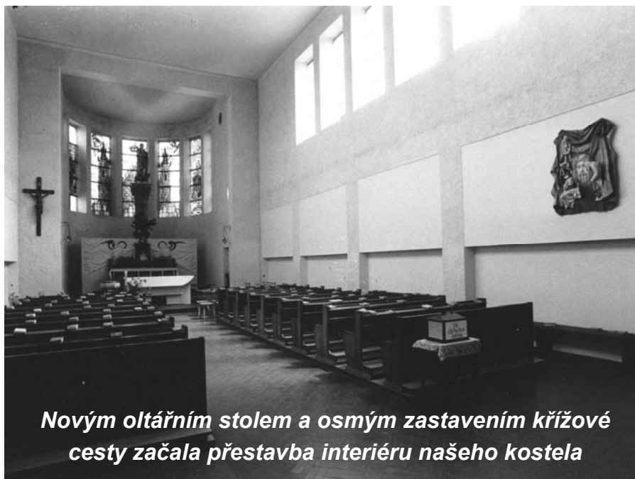
Novým oltářním stolem a osmým zastavením křížové cesty začala přestavba interiéru našeho kostela