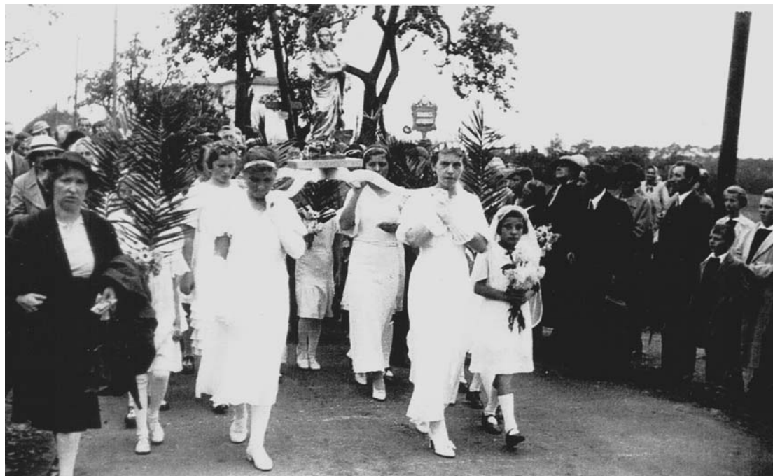
Další archivní foto ze svěcení sochy P. Marie Královny 6. září 1936