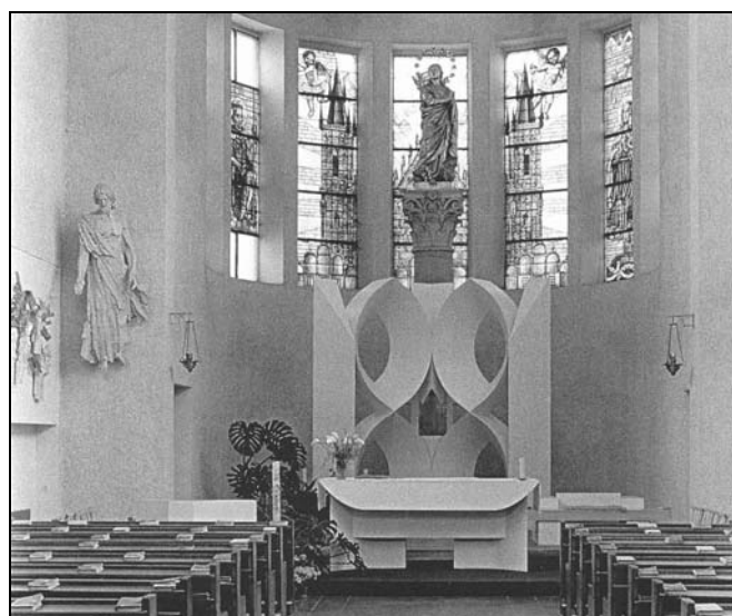
Původní interiér a nový podle návrhu Ing. arch. Václava Dvořáka