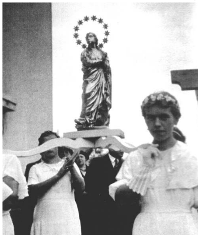
Svěcení sochy Královně Míru 6. 9. 1936