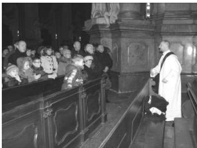
Závěrečná bohoslužba slova potmě