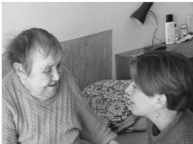
Rozhovor pečovatelky s klientkou

Vážení přátelé, přeji vám všechno dobré do začátku nového kalendářního roku. Především, aby byl pro nás všechny, vaši farnost i naši Charitu požehnaný.