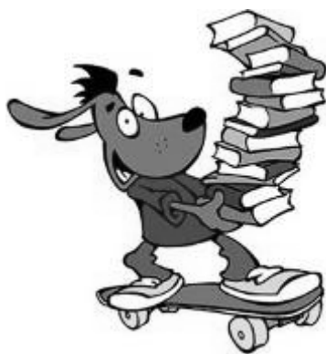
Téma karnevalu: Hrdinové z knížek

Další informace jsou na stránkách http://karneval-lhotka.webnode.cz/ .