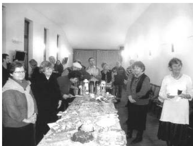
Dámy připravily spoustu dobrot