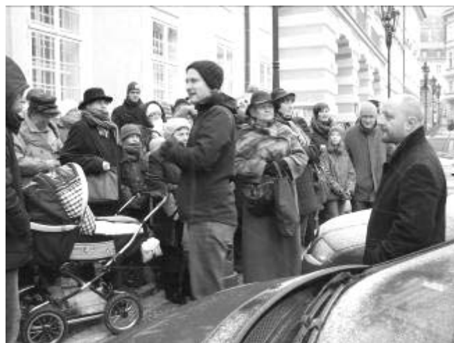
Se začátkem výkladu začalo sněžit.

kolik vás je!“ „Budeme se tedy počítat. Jedna, dva, tři... padesát pět dospělých a děti.“