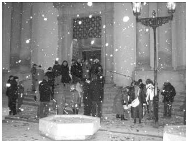
Při odchodu už řádně chumelilo

zнову šéf ochranky a že prý musíme odejít v 16.10.