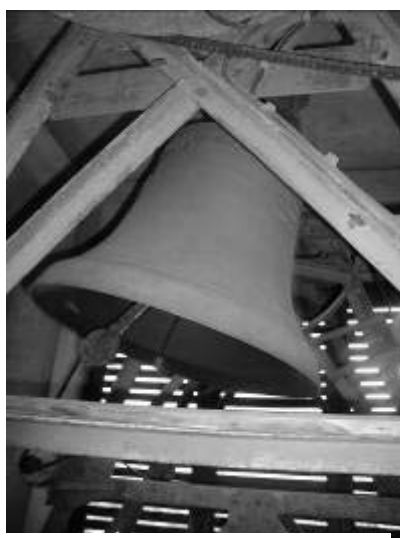
Zvon Královna míru

Ozvěny koled doznívají již jen v našich vzpomínkách, pozůstatky silvestrovských petard z lhoteckých ulic odvál čas a my si pomalu zvykáme psát letopočet, který podle přesvědčení různých apokalyptických vizionářů ani neměl nastat. Zkrátka a dobře, konec času zůstává i nadále zahalen ne snad rouškou, ale pořádnou plachtou tajemství a den, kdy nastane, je stále, ať chceme či nechceme, znám pouze Hospodinu. Nám, pozemským červíčkům, nezbývá nic jiného, než se s touto skutečností smířit a poznenáhlu začít přemýšlet, co od právě nastalého roku bude lze očekávat. Přirozeně nemám na mysli úvahy o volbě nového českého prezidenta, či sázky na výdrž nebo rozpad vládní koalice. V tomto roce si totiž, dá-li Bůh, společně připomeneme událost, která svým významem přesahuje naši nevelkou českou a moravskou kotlinu, a to 1150. výročí příchodu slovanských věrozvěstů na Moravu. Připomínat dílo a zásluhy Cyrila a Metoděje není ničím víc, než oním příslovným nošením dříví do amazonského pralesa, a tak se omezím na pouhé